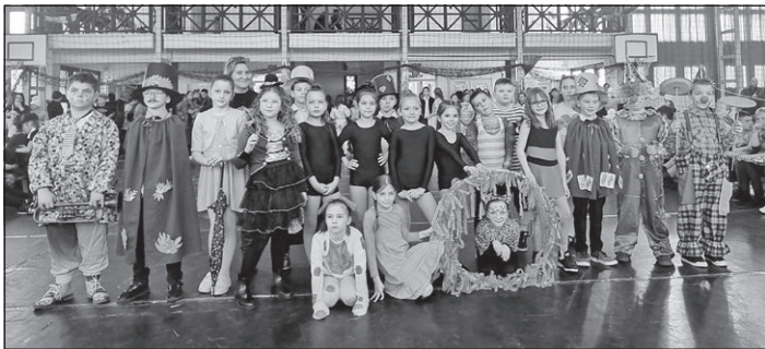
A 2. osztály parádés cirkusza

A rendezvény egyik legizgalmasabb része a jelmezes felvonulás volt, ahol a diákok kreatív és ötletes maskarákba bújva mutatták meg egyedi stílusukat. Az egyéni jelmezeseik után az osztályok adták elő csoportos produkciójukat.