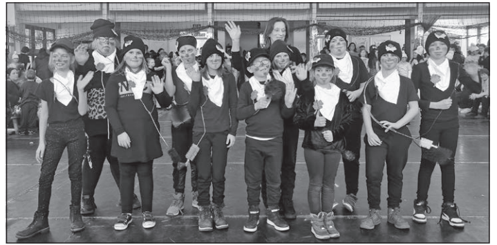
A 3.-os mázlista kéményseprők

Igazán hangulatos, kreatív és vicces bemutatók voltak, így a zsűrinek nem volt könnyű dolga a legjobb jelmezek kiválasztásában. Minden jelmezes egy kis finomságot és oklevelet kapott elismerésül.