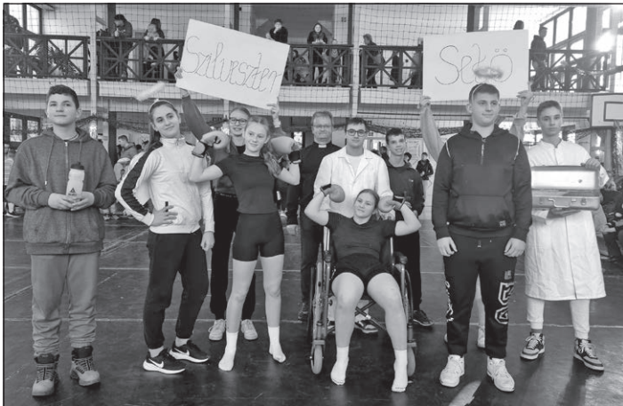
A 8.-os bokszmeccs

A színes és vidám csoportos jelmezek között megjelentek méhecskék, cirkuszi társulat, kéményseprők, hupikék törpikék, időutazók, ősemberek, kalózkodók, sőt még egy izgalmas bokszmeccset is láthattunk.