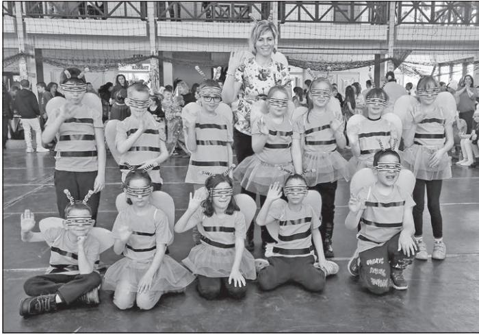
Az elsős kis méhecskék

Iskolánkban február 21-én került megrendezésre a farsangi bál. Fergeteges farsangi mulatságot tartottunk pénteken délután, amelyen a gyerekek hatalmas lelkesedéssel vettek részt.